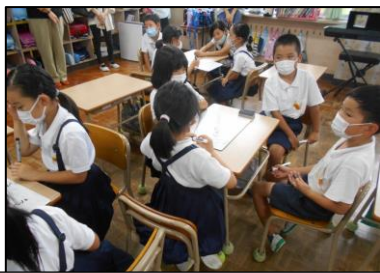
2年生は班で意見を出し合う様子を見ていただきました。