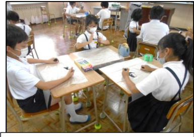
3年生は図工で制作。3人一組の班で進めました。