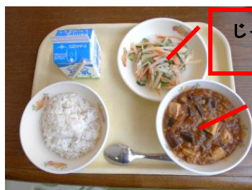
じゃがいものシャキ シャキサラダ

今月は、6月21日（月）が「キャロッピーデー」、22日（火）が「ふるさとくまさんデー」でした。21日のメニューは、「ごはん、マーボーなす、じゃがいものシャキシャキサラダ」、22日のメニューは「太刀魚丼、あまなつとサラたまのサラダ、わかめのみそ汁」でした。なすは菊陽町産で、豆腐とともにたっぷり入れてありました。なすは夏の定番の野菜ですが、なすの皮の紫色（ナスニン）には、体の調子を整える働きや、血液をきれいにしたり、目の疲れを癒やしたり、がん予防効果もあるそうです。また、今回の「ふるさとくまさんデー」は、水俣・芦北地区の特産品である、太刀魚、サラダ玉ねぎ、甘夏が使われたメニューでした。太刀魚丼は、ご飯の上にキャベツをのせて、その上にタレのかかった太刀魚をのせていただきました。給食で太刀魚がいただけるとは・・・何とも贅沢です。ここから少し離れた土地のことに思いを馳せながらいただくと、一層おいしく感じられるかもしれませんね。