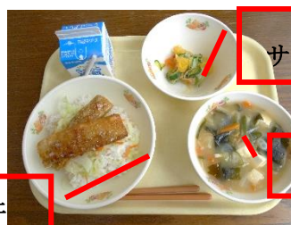
あまなつと サラたまのサラダ