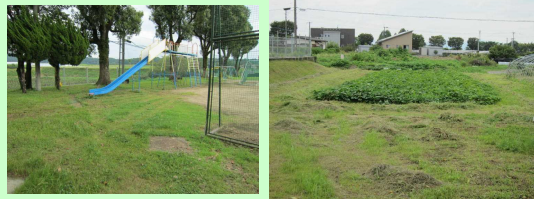
(きれいになった運動場とグリーンパーク)

8月18日（日）のPTA愛校作業には、多数参加いただきありがとうございました。伸び放題だったグリーンパークや運動場の草が、瞬く間にきれいになり、前期後半を気持ちよくスタートすることができました。子どもたちは、きれいに整備された運動場で、毎日楽しく活動しており、グリーンパークでの観察もスムーズに進むことだと思います。本当にお世話になりました。