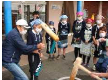
こうやってつきますよ!

12月13日(木)に南部町民センターで、餅つきがあり、6年生13名が参加しました。この餅つきは、毎年、南部町民センター主催で「老人会(地域)と児童のふれあい餅つき」として開催されています。