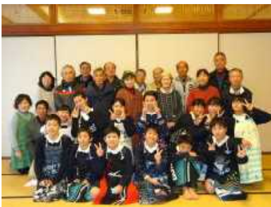
平成最後の餅つき記念写真です