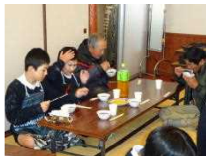
餅は地域の皆さんといただきました

餅つきが始めてだった、幼稚園や保育園のころ以来という児童がほとんどでしたが、次第に杵を上手に使えるようになり、全員で2臼分の餅をつきました。ついた餅は、熱々のうちに丸めます。婦人会の皆様に上手に餅をちぎっていただき、そのあと6年生が、さらに小さくして丸めていきます。熱い餅にみんなびっくりしていました。餅とり粉で化粧したみたいに顔が白くなった児童もいました。