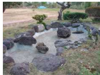
きれいに補修された池