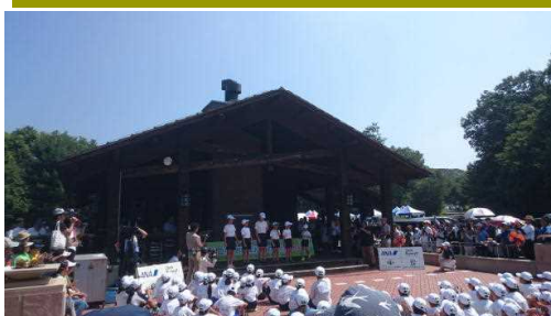
開会式でのチーム紹介の様子

7月15日(日)に福島県で開催された、スナッグゴルフ全国大会で、南小学校チームが猛暑の中活躍し、昨年度から10以上ランクを上げ19位という成績を残しました。ライバルチームを抑え、九州から参加したチームの中ではトップの成績でした。参加した6人がすべて自己ベストの成績を残すことができ、とてもいい経験を積むことができました。あいにく帰ってくる日は、羽田空港の滑走路に穴が空いた日で帰宅は夜11時過ぎとなってしまいましたが、翌日は疲れもありながら、みんなが笑顔で成績を報告に来てくれました。最後までお世話になった方々へきちんとお礼を述べている姿に、一段と成長を感じました。応援していただいた皆様、大変お世話になりました。