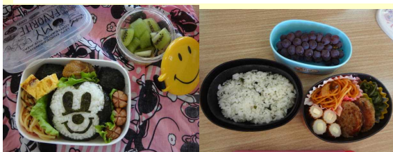
5年生のお弁当から

7月に入って、11日(水)、18日(水)に「みなみっこオリンピック」7月19日(木)に「サウスくんデー」を実施しました。「みなみっこオリンピック」「サウスくんデー」とは、縦割り班(全校児童を1～6年生が均等になるように分けて構成した班)で、体育活動、集団生活に取り組むものです。特に「サウスくんデー」は給食、昼休み(レクリエーション)掃除と一緒に生活するという取組です。各班の6年生がリーダーとして、班のみんなを動かしていきます。上級生が下級生の給食のお世話をしたり、みんなが楽しめるようなゲームを企画したりして活動しました。