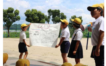
オリンピックはじんとりから!!

熱中症対策のため外での活動を停止してもらいましたが、6年生は、短い打ち合わせの時間を精一杯うまく使って計画を練り直し室内での活動に変更して対応していました。その成果で、どの班も充実した時間を過ごすことができました。6年生のリーダーシップには感心させられました。