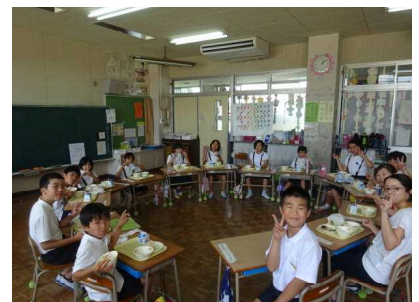
縦割り班で給食です

7月15日(日)に福島県で開催された、スナッグゴルフ全国大会で、南小学校チームが猛暑の中活躍し、昨年度から10以上ランクを上げ19位という成績を残しました。ライバルチームを抑え、九州から参加したチームの中ではトップの成績でした。参加した6人がすべて自己ベストの成績を残すことができ、とてもいい経験を積むことができました。あいにく帰ってくる日は、羽田空港の滑走路に穴が空いた日で帰宅は夜11時過ぎとなってしまいましたが、翌日は疲れもありながら、みんなが笑顔で成績を報告に来てくれました。最後までお世話になった方々へきちんとお礼を述べている姿に、一段と成長を感じました。応援していただいた皆様、大変お世話になりました。