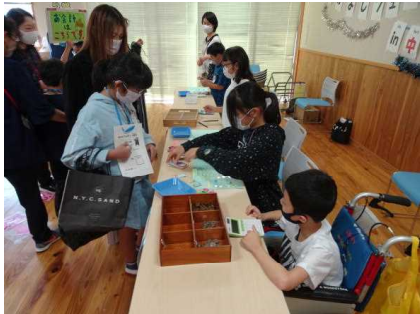
↑ レジ係 お金の計算

本校では、今年度、44名の子どもがあすなる学級（特別支援学級）で学んでいます。日頃子ども達は、各学級で、担任による個々の特性やニーズに応じたきめ細かな授業を受けたり、交流学級で過ごしたりしています。その学習の成果を発表する「なかよしフェスタ」が保護者同伴のもと、開催されました。当日は、ビーズ等で創作した品物を販売したり、ゲームコーナーを設置したりして、実に楽しそうに活動する様子を見ることができました。後半には、私にそっくりな!?「さがっち」が登場。楽しいレクリエーションを行ってくれたようです。本当に素直なあすなる学級の子ども達、今後の成長が楽しみです。