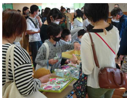
↑ 手作りの品が並ぶ