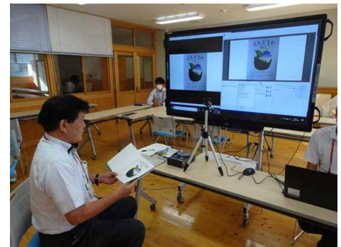
↑ 校長の話；会議室から

秋休みの間、静まり返っていた学校も、また、皆さんの歓声でにぎわいを取り戻しました。わずか5日間の秋休みでしたが、大きな事故や病気の連絡もなく、みんな元気に過ごせたようで安心しました。