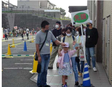
↑ 入場を待つ保護者