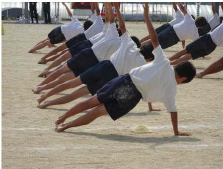
↑ 6年表現「ONE HEART」

コロナ禍の運動会開催。密にならない練習を工夫し、プログラムも縮小、低・中・高別にまとめて競技を行う、教室でのライブ配信視聴と応援・・・例年になく「特別な運動会」ができました。好天にも恵まれ、子ども達は、笑顔で精一杯の力を発揮し、光輝いていました。今年度の運動会を無事に終わることができたのは、本校PTA役員の皆様をはじめ、参観された保護者の皆様方の御理解と御協力があったからです。受付・入場・退場・再入場と面倒な動きをお願いしましたが、実にスムーズに動いていただきました。中部小の保護者の方々は、強力な「応援団」です。深く感謝を申し上げます。我々は子どもの姿で「恩返し」を致します。