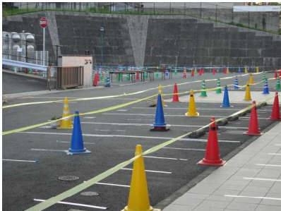
↑ 入場制限のための柵