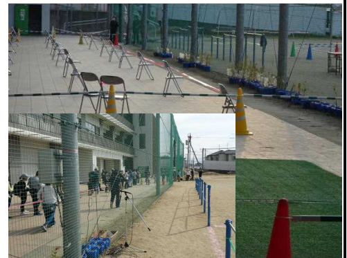
↑ 再入場待機場所の設置