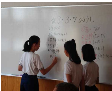
↑ ホワイト黒板を使って

☆ 今年も各学年を赤団と白団の二つに分け、団対抗戦で競技を行います。 6年生の団長さん、副団長さんを中心に盛り上げてくださいね。赤勝て！白勝て！