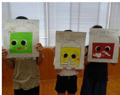
↑ 3つのちゅうぶくん

本校の教育目標達成のために、重点的に育成をめざす資質・能力として、下記の3点を掲げて取り組んでいます。