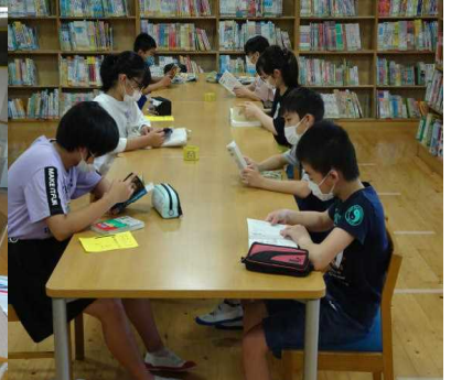
↑ マスク着用、できる限りのソーシャルディスタンス、図書室も学級分散利用。