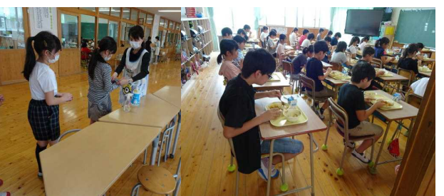
↑ 給食前の手洗い、指先まで丁寧に洗います。食べる前の消毒、前向きで黙って食べる。