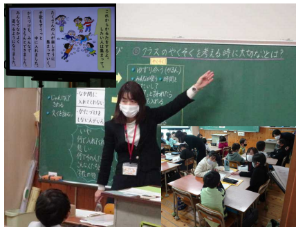
↑ 3年1組 道徳