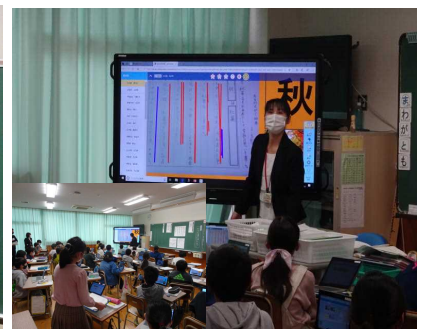
↑ 5年4組 国語