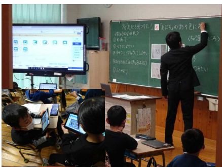
↑ 2年2組 図工