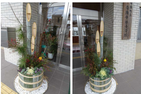
↑ 正面玄関前に飾られた門松