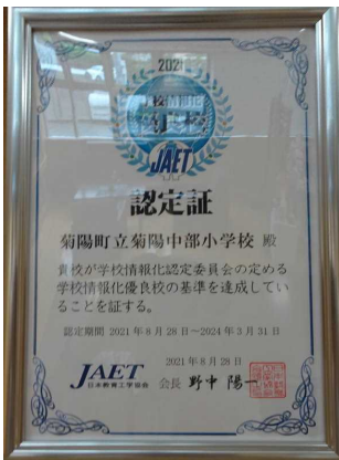
↑ 学校情報化優良校認定証

令和3年度 熊本県教育委員会指定「くまもとGIGAスクールプロジェクト中心校」 ～12月17日（金）、3つのクラスで授業を公開しました～