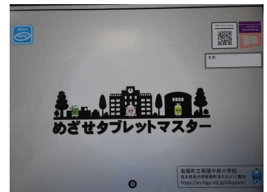
↑ タブレット使用法リーフレット

昨年度末、町内全小中学校に一人1台の「タブレット」が配備されました。よって、今年度は授業等で如何にその効果的な活用を図っていくのか研究することが求められました。始めは、児童にその使い方やルールを教える必要がありました。e-中部タイムと称して、朝活動の時間に活用スキルを身に付けさせました。児童はマスターすることが早く、今ではどの学級でも活用が頻繁になされています。そして、日々の努力が実を結んで、学校情報化優良校の認定を受けることができました。先日は、3学級で授業を公開し、各教科等でのタブレット活用の可能性を広げる提案ができたと思います。今後も児童の学力向上のために研究を重ねていきます。