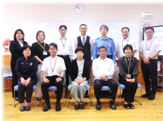
【令和6年度学校運営協議会委員の方々】

本年度の学校経営の方針について説明し、委員の皆様からご承認いただきました。また、それぞれの学級の授業の様子や校内の施設等を見ていただきました。子どもたちが落ち着いた雰囲気の中で学習に臨んでいる姿をご覧になり、「いいですね。」という言葉がたくさんいただきました。委員の方々と話しながら、地域の方々の子どもたち、そして学校を大切に思う気持ちが強く伝わり、その思いに込めていかねばという気持ちが高まりました。1年間、どうぞよろしくお願いいたします。