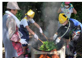
煙にもめげず茶煎り

五月十日（木）、光教寺さんのご厚意で、今年度も茶摘み・茶煎り・茶揉み体験を行うことができました。 一々四年生は、光教寺で、スーパール先輩方と一緒に茶摘みをしました。 老人会長さんのご協力で、なんと二十人のスーパール先輩がご参加くださいました。 一々四年生の子ども達と同じ人数です。そこで、子どもとスーパール先輩がペアになって茶摘みを行いました。お茶の摘み方を教えていたいたなみ方を教えていたないたり、いろいろな話をしてたりしながら楽しくお茶を摘むことができました。 校で、五・六年生が六人のスーパール先輩に教えていた茶作りが、茶煎り・茶揉み・茶揉み・茶煎りを煙にもめげず茶煎り