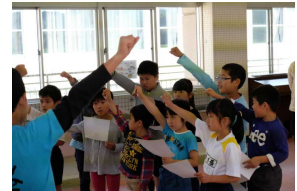
応援団結団式の様子

五月二十七日は運動会です。九日には、赤白応援団の結団式を行いました。 応援団員が自己紹介した後に、さっそく応援歌の練習がスタートしました。始めは応援団員も一々、四年生も緊張気味で声が小さかったのですが、だんだんと声も大きくなりました。これからが楽しみです。 学年の練習も始まり、今週からは、全体練習も始まります。体調を整えて、自分の力を出し切ってほしいと思います。 運動会のスローガンも代表委員会で決まりました。一年生から六年生みんなの思いがこもったスローガンです。一人一人が自分のめあてをもって運動会に取り組んでいます。運動会等の行事は子ども達が大きく成長するチャンスです。運動会が楽しみです。