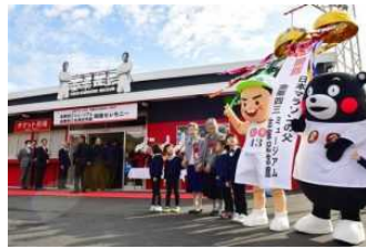
金栗四三の立志伝