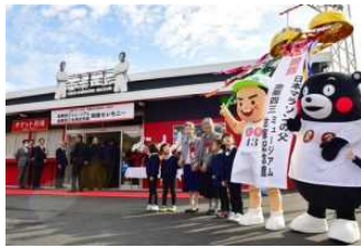
金栗四三の立志伝