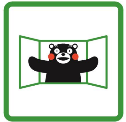
かんきをするモン