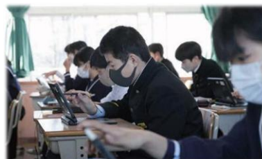
解説動画付き教材で個に応じた学びの充実