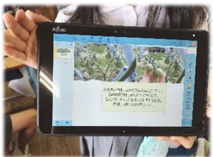
小学校低学年から日常的な端末活用

1人1台の学習端末(タブレット等)を活用し、「学力向上」、「不登校対策」、「情報活用能力の育成」を進めるなど、地域の実態に即した組織的な取組みが評価されました。