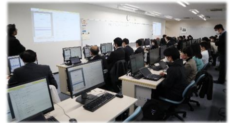
高校・情報Iプログラミング担当者研修会の様子

熊本高等専門学校との連携の一環として、「第1回高校・情報Iプログラミング担当者研修会」を実施しました(R5.2.15)。高等学校の「情報I」を担当する教員に対し、熊本高専の教員が講師となりプログラミング演習を行いました。