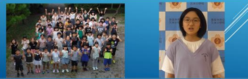
多良木町立久米小学校

テーマ 「みんななかよく、 がっこう げんき ちいき 学校の元気を地域にとどけよう」