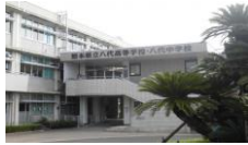
県立八代中学校・八代高等学校

～熊本県では、令和6年度から八代中学校・八代高等学校に国際バカロレアの導入を目指しています～