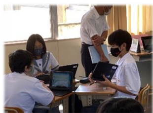
考えを表現するツールとしての端末活用