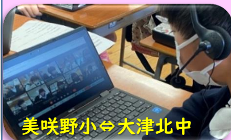
美咲野小⇄大津北中

校種の違う児童生徒が英語で互いにやり取りし、コミュニケーションの楽しさを実感しました