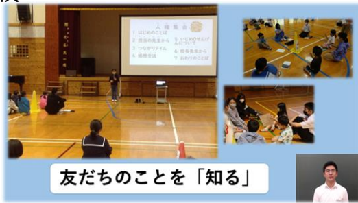
友だちのことを「知る」