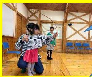
大人から子どもまで、みんな で楽しみました