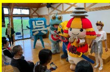
ころう君と仲間たちによる 楽しいショー