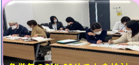
各学年のCAN-DOリストを検討

小中英語担当教員向け研修を年2回実施し、大津町版「CAN-DOリスト」を作成しました