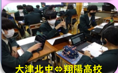
大津北中⇄翔陽高校