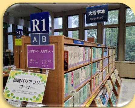
県立図書館の「拡大図書」コーナー