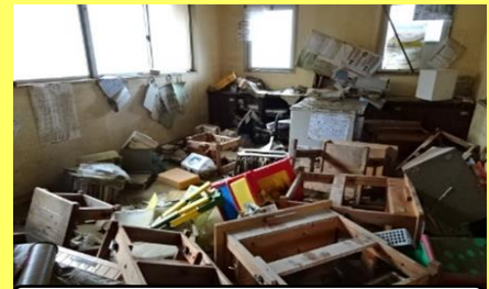
球磨村立渡小学校(浸水被害)