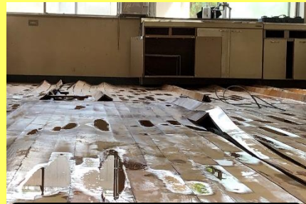
県立芦北高校(教室床の反り)