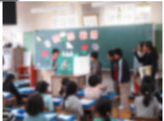
【 6年生の読み聞かせの様子 】

4年生は昨年度同様に元気いっぱいです。学級の中でも進んで手伝いをしたり、登校班の中で、遅れそうな1年生に手をつないだり、一緒に付き添ってくれていました。