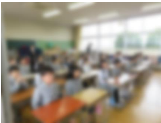
← 【 1年生の学習の様子 】