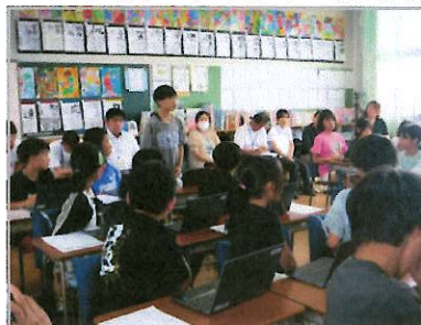
気付いたことの発表

7月1日（水）、嘉島町の3校の小中学校で、合同の授業力向上研究会が行われました。西小では、6年1組の国語「デジタル機器と私たち」の授業を公開しました。授業の中では、生成AIを活用して文章を推敲する、という場面もありました。参観した先生方からは、「生成AIのイメージが更新され、可能性を感じた。」「生成AIを丸写ししてしまうの