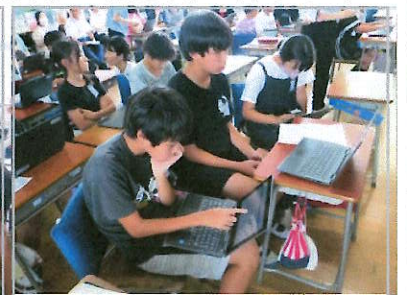
友だちの提案文に助言

ではないか、という懸念があったが、授業を見て払拭された。」「児童同士の関係性、教師と児童の信頼関係、安心して発言できる学級の土台があつてこそ成立する授業だった。」などの感想がありました。日頃から子どもたちが、授業者の先生と一緒に、一生懸命授業に取り組んでいる姿が認められて、大変うれしかったです。これからも、自らの力で学ぶ力、学び合う力、情報活用能力等を高めていくことを期待します！