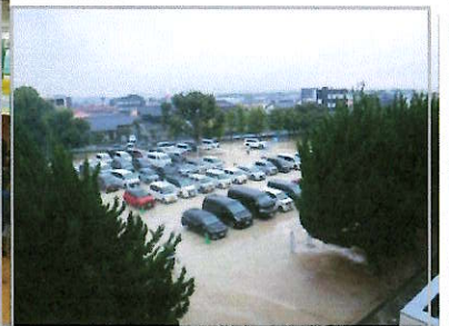
多くの車が集まった運動場