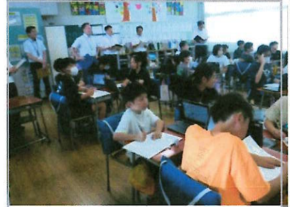
上益城教育事務所の訪問

「子ども達はとても落ちついて授業に取り組んでいました。授業に集中できるような環境づくりもできていると感じました。」（上益城教育事務所指導課長）