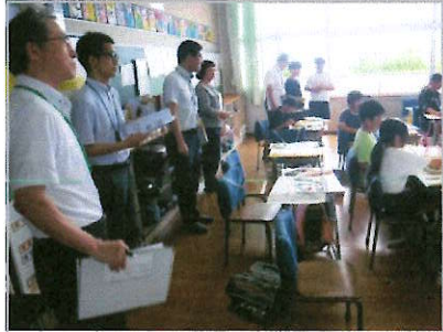
嘉島町教育委員会の訪問

6月12日（金）に上益城教育事務所の方々が、6月22日（月）には嘉島町教育委員会の方々が嘉島西小学校の様子を見に来られました。両日とも、本年度の学校の取組などを説明した後、2時間かけて全クラスの授業を見ていただき、それぞれの印象や感想などを聞かせていただきました。主なものを紹介します。