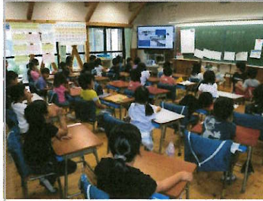
リモートでの防災集会

6月19日（金）、あいにくの天気の中、大雨を想定した防災集会と、引き渡し訓練を行いました。保護者の皆様には、天気の悪い中ご協力いただき、ありがとうございました。子ども達は真剣に集会・訓練に取り組んでくれていました。本番の日は来ない方がよいですが、もしもあった場合は今回の反省を踏まえ、さらにスムーズな引き渡しにつなげたいと思えます。