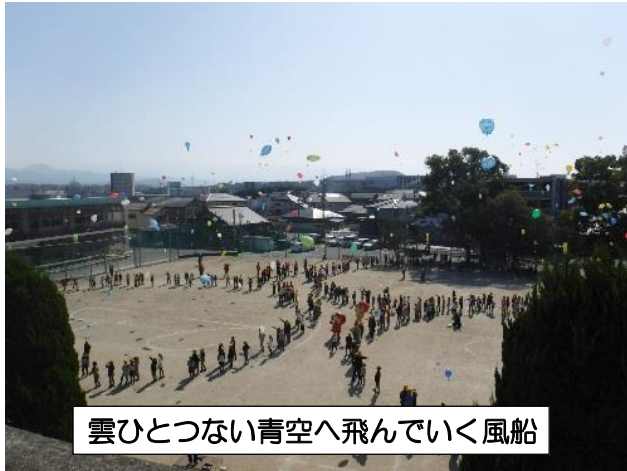
雲ひとつない青空へ飛んでいく風船

ハガキをいただいたことで、子どもたちは、人権の花運動の取組が様々なところに広がっていくのを実感できました。児童運営委員会が提案している「仲間はずしをしない。」「いじめダメ。」の2学期の目標ともあわせて、人権の輪を広げていきたいと考えます。