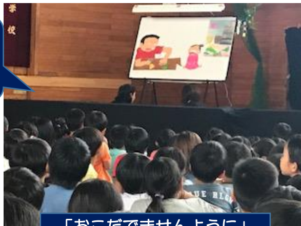
「おこだでませんように」

お話は、「ひぐらしえんぴつ」と「おこだでませんように」の2作。場面が変わると、語りに合わせて、パネルに手作りの絵が次々に張り替えられていきます。バックには、ピアノの生演奏も。穏やかな雰囲気の中で、子どもたちは身じろぎもせずお話を聞き、また、食い入るようにパネルを見つめていました。子どもからは、「今度はいつあるの?」との声が聞かれるなど、大人気のパネルシアターでした。