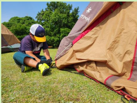
テント設営・テント泊