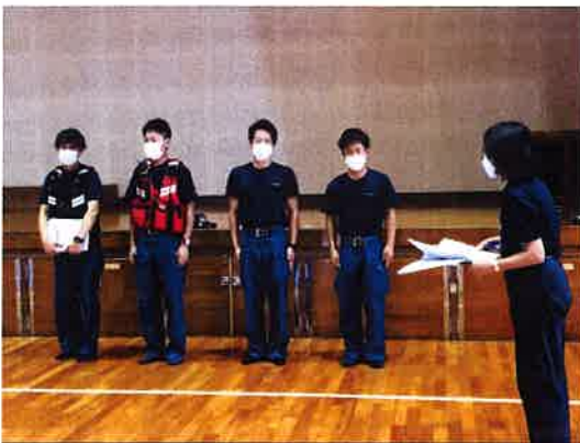
4名の小川分署のみなさん

6月23日（水）に小川分署の方々をお招きして、子供たちを、職員を、命を守るために全職員で救命救急研修を行いました。特に、胸骨圧迫の方法とAEDの使い方の研修を実際に練習用の人形やAEDを使いながら行いました。胸骨圧迫をすぐに行うことで命を救えること、救急車が到着するまでとにかく続けておくことなどの説明がありました。水泳の授業も始まりましたが、このような事態にならないようにすることがまず重要だと考えます。