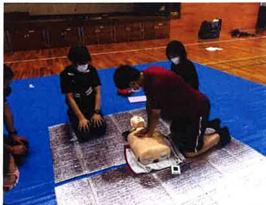
練習用人形を使って胸部圧迫の練習