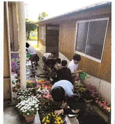
通路に飾る花の準備