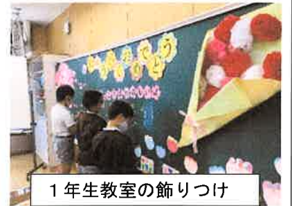
1年生教室の飾りつけ