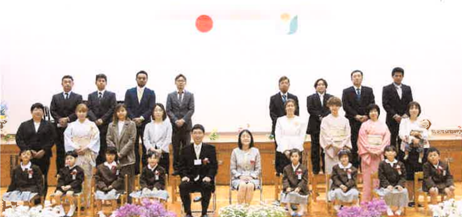
新1年生の児童と保護者の皆様