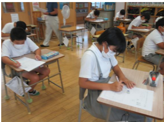
5年生 保健のテスト