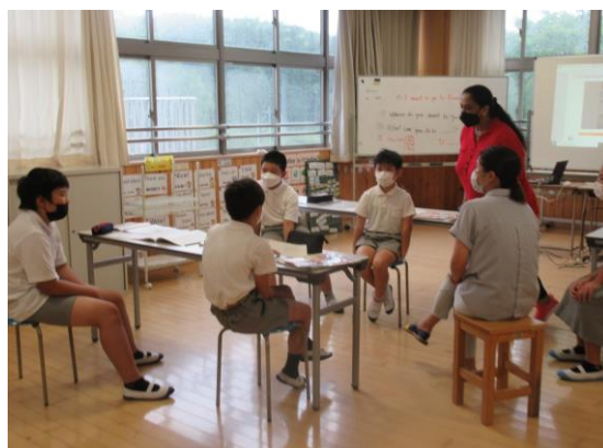
6年生 外国語の学習