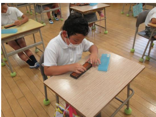
3・4年生 そろばんの学習