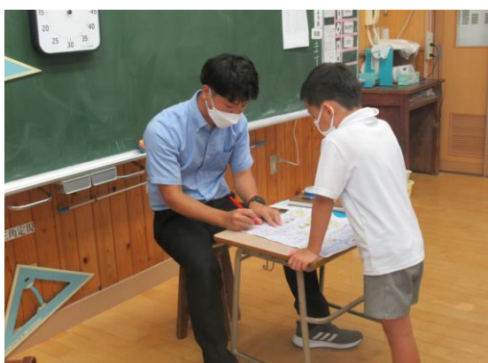
2年生 テストの間違い直し