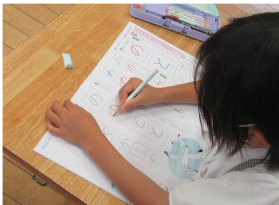
1年生 ひらがなのまとめ

○夏休み前の集会は、リモートで行いました。その後は、学習のまとめを各学年ごとに真剣に行いました。