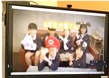
アイデア満載の動画