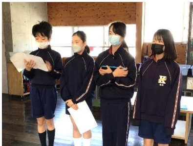
司会進行は5年生です

そして送別遠足。最後の思い出に、6年生は1年生と手をつなぎ、瞑想の森公園まで歩きました。遠足と言えばお弁当。この日は「お弁当の日」の取組として、子どもたちもお弁当作りを手伝うことになっていました。できる範囲でのお手伝いなので、お箸を自分で準備するだけでもOKなのです。中には、全部ひとりで作ったという子もいました。おいしいお弁当を食べて、時間いっぱい遊びました。この日、地域の方が、シャボン玉や風船を子どもたちのために用意してくださり、子どもたちは大喜びでした。ありがとうございました。