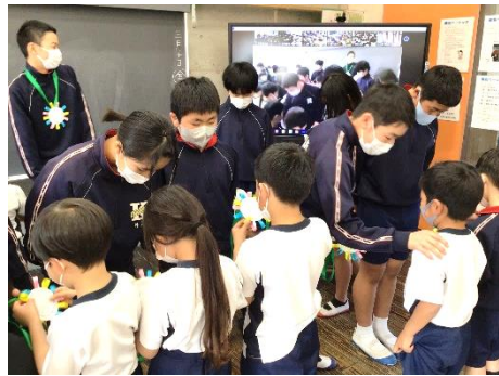
やさしい6年生 「ありがとう」 1年生からメダルを プレゼント