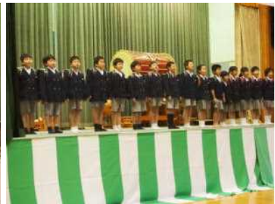
2年「ぼくたち わたしたち こんなに大きくなったよ」