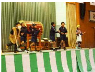
3年「進め!! 緑の少年団!!」