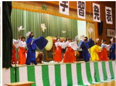
4年「鹿北のお茶と神楽」 ～地域の方から教えてもらったこと～