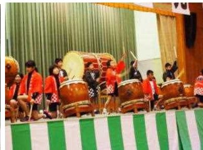
6年「響け! 鹿北太鼓」 ～夢をのせて～