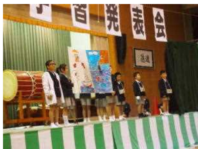
5年「水俣の学習」 ～5年生からのメッセージ～