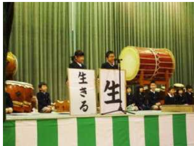
1年「できるようになったこと」