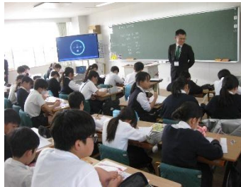
【6年生の授業の様子↑】

授業参観では、どの学級も子どもたちはメリハリをつけながら、主体的に学習している様子が見られました。また、1年生では、保護者と協力しながら、アサガオの種を植えていました。