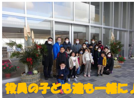
役員の子ども達も一緒に♪