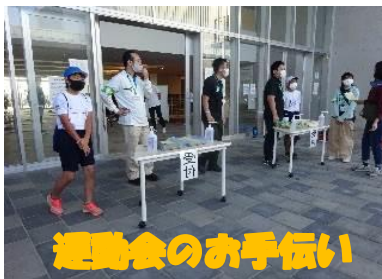
運動会のお手伝い