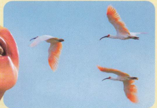
JA佐渡はトキ繁殖を願い ネオニコ系農薬の販売を中止