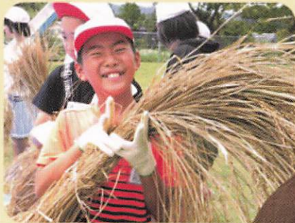
ゼロからオーガニック給食を実現させた いすみ市