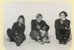
エンディングテーマ クラムボン

「夢みる給食」上映会&トークイベント 1月19日(日) @松島総合センターアロマ