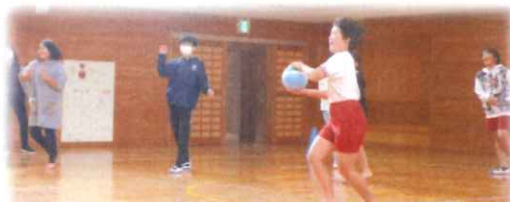
ドッジボール対決 5、6年生 VS 先生たち

ある日、突然！5、6年生から挑戦状が！職員室に届きました。決戦の日のは2月28日(月) 場所は体育館、ドッジボール対決が行われました。たくましく成長した子どもたち VS 老若混成？教員チームが1つのボールに 全集中! 一進一退の攻防が続きました。結果はTime Upで引き分けでした。気持ちの良いひとときでした。