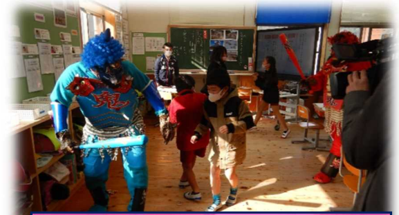
校内人権集会 2月19日(金)