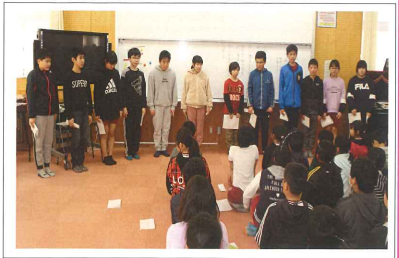
2月21日 「人権集会」 6年生の発表