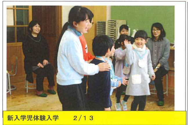
新入学児体験入学 2/13