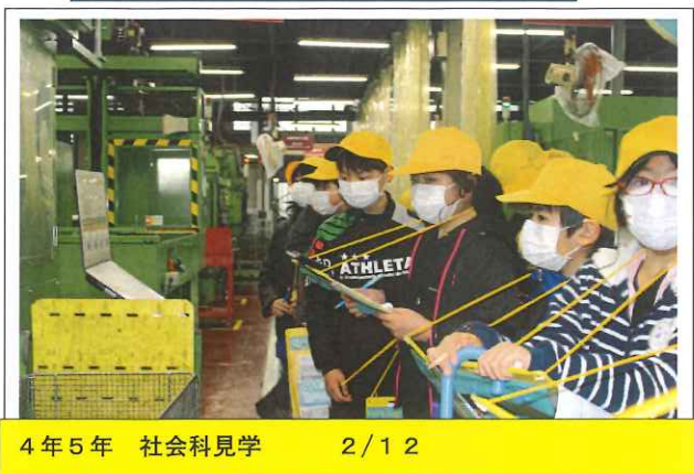
4年5年 社会科見学 2/12