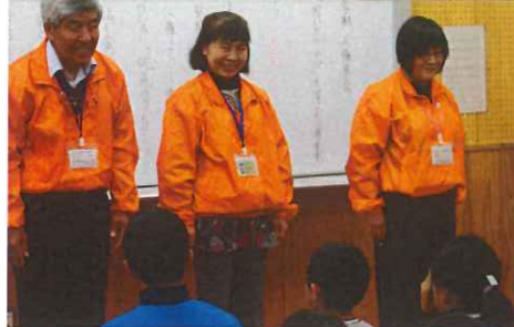
保健体育委員会発表 11/29