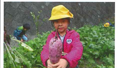
赤大根と大根、サツマイモが収穫できました。