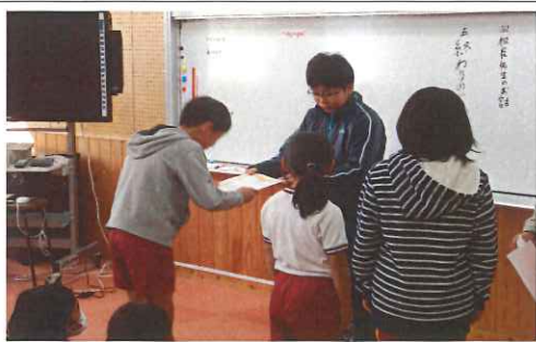
図書委員による図書集会