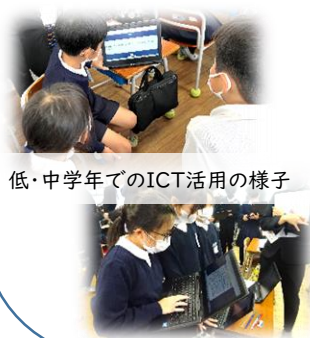
低・中学年でのICT活用の様子

全ての小中学校での学校情報化「優良校」の認定取得、ICT活用指導力向上研修、デジタル教科書活用指導力向上研修、ステップアップ研修等、教職員の指導力向上に関する様々な取組が評価されました。