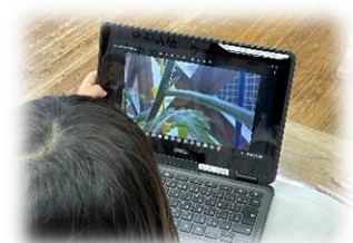
低学年でのICT活用の様子 ＜水上村立岩野小学校＞

この度、水上村教育委員会が学校情報化「先進地域」に認定(R4.10.19)されました。