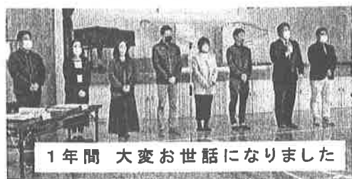
1年間 大変お世話になりました

令和三年度の役員の皆様、一年間大変お世話になりました。令和四年度の役員の皆様、来年度よろしく願いいたします。