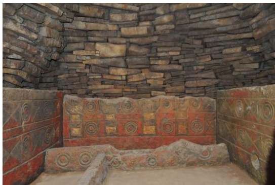
千金甲1号墳内の石室 (レプリカ)

また、装飾古墳に使われている石材と同じ硬さの石版に、古墳館で復元した顔料で装飾古墳の文様を描く「古代絵画教室」や「勾玉づくり」など、様々な体験メニューを企画しています。装飾古墳館でのレプリカの見学や様々な体験をとおして、古代のロマンを感じてください。