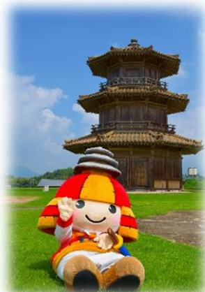
鞠智城 イメージキャラクター ころう君

第2・第4水曜日は ころう君の 鞠智城での巡回日！ 土日もたま～に 巡回しています！