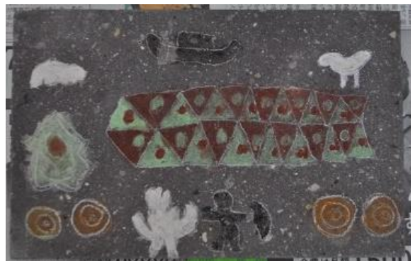
石版に描いた装飾古墳文様 (古代絵画教室参加者の作品)