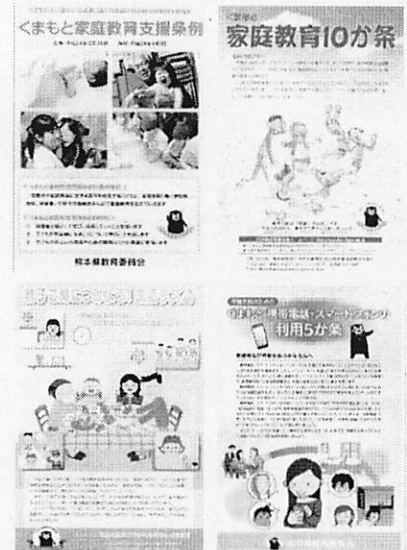
【家庭教育広報資料(チラシ)】 ※要望に応じて支援チームにお届けします!