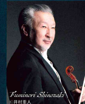
Tominori Shinozaki