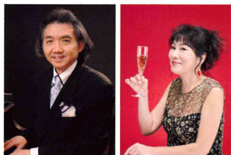
プロデュース・指揮 / 作曲・編曲：出田敬三

18時15分開場 19時開演 熊本県立劇場コンサートホール 全席自由 / 一般 2,500円 学生(大学生以下) 1,500円