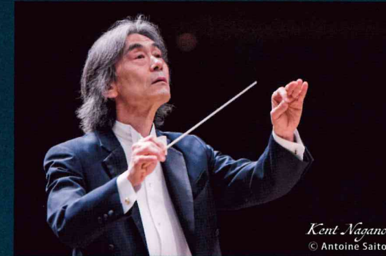
Kent Nagano