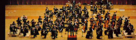
オーケストラ：九州交響楽団