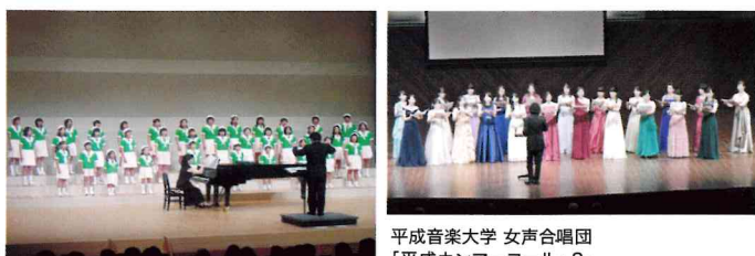
熊本少年少女合唱団