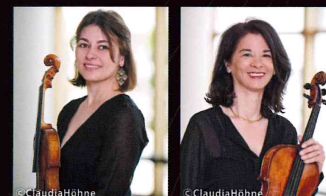
ヴァイオリン： ジョアンナ・カメナルスカ

指揮：ケント・ナガノ オーケストラ：九州交響楽団 ヴァイオリン：ジョアンナ・カメナルスカ (ハンブルク・フィル・コンサートマスター) ヴィオラ：ナオミ・ザイラー (ハンブルク・フィル・ソロヴィオラ奏者)