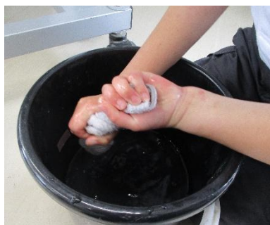
ぞうきんはバケツの水で洗う