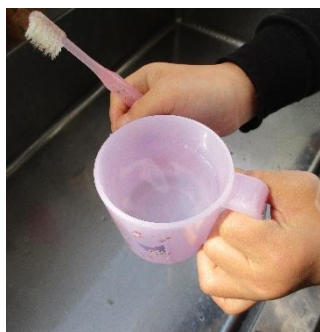
コップ1杯の水で歯磨き

現在、天草市では渇水が問題となっています。貯水率が40%を切ったという報告がありました。本校では、学校全体で環境 ISO 宣言に取り組んでいます。環境 ISO 宣言とは、「環境にやさしい学校づくり」を目指し、具体的な行動目標を決め、実践、評価する取り組みです。そこで、環境美化委員会を中心に節水週間（2月9日～20日）を設け、「北小 ISO 宣言」の中でも、「水の出しっぱなしをなくします」という項目に力を入れることにしました。また、各学級で目標を設定し、取り組んでいるところです。