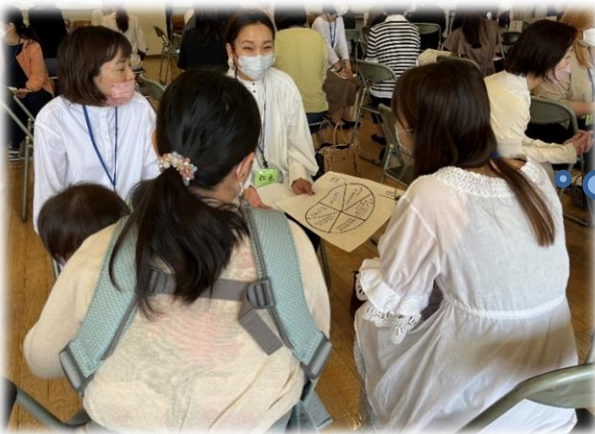
推進園における「親の学び」講座