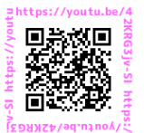
【考えよう！ スマホとの距離】