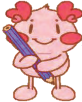
ゆうあい中学校キャラクター ゆあちゃん

申し込みは 「①Web申込み」または 「②電話申込み」で行う ことができます。 たくさんのご参加を お待ちしております。