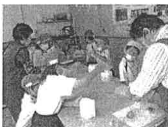
『あまびえ』制作中！ みんな上手に作りました！

今回は、下浦方面へ探検に出かけました。コミセンの方も弁天会の方もとてもやさしく親切に対応してくださいました。弁天会での泥人形作りでは、子ども達のリクエストに応じていただき、『あまびえ』の制作を体験してきました。地域絵付けの指導にも来てくださるようで、楽しみにしているようです。