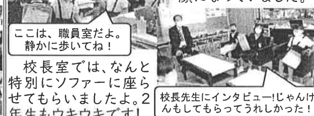
ここは、職員室だよ。 静かに歩いてね！

連休明けの月曜日、この日は、1年生との学校探検の日でした。4つの班に分かれて『1年生に優しく』『楽しんでくれるように』と、これまで準備を頑張ってきました。教室の説明をしたり、シールを貼ってあげたり、すっかりお兄さん、お姉さんの顔になっていました。