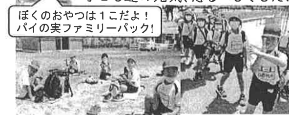
ぼくのおやつは1こだよ！ パイの実ファミリーパック！

心配していた天気も晴れ！去年は雨で行けなかった分、実施できて本当によかったです。朝からおやつの見せ合いっこが始まりました！旧瀬戸小までは少し遠かったですが、お弁当タイムで元気を取り戻した子ども達。「あ～、お母さんのお弁当はサイコー！」という声が！追いかけてこでは、追いつかず…子ども達の元気、恐るべしでした！