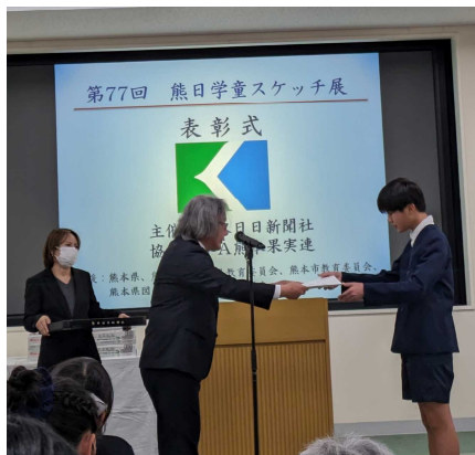
表彰を受ける 6年生と 学校賞の橋

賞状が届き次第表彰します。「とことんがんばる」本渡東小の子どもたちのさらなる活躍を期待しています。